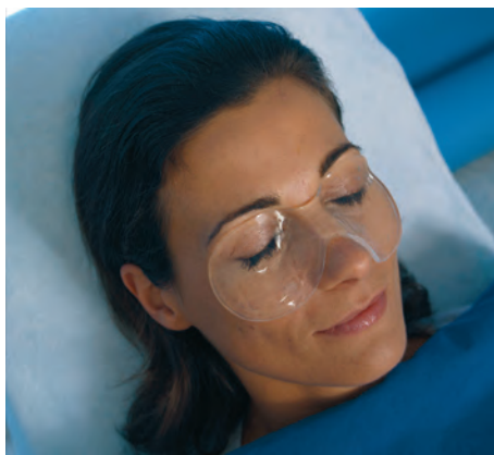
Ryc. 3. HydroAid® Eye Mask, opatrunek hydrożelowy w postaci maski, w zabiegach blefaro-plastyki.