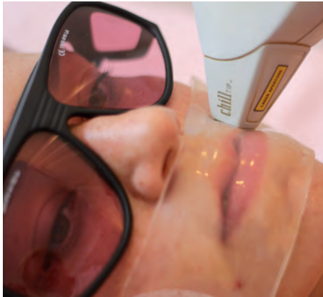
Ryc. 5. Opatrunek hydrożelowy stosowany po zabiegu fotoepilacji.

nie uległ całkowitemu zamrożeniu. Gdy stosujemy hydrożel podczas nieablacyjnych zabiegów laserowych, opatrunek nagrzewa się, stąd można wspomóc się cold packiem i położyć go na opatrunek. Po minucie opatrunek schłodzi się i będzie gotowy do ponownego użycia. Działanie to można usprawnić, stosując naprzemiennie dwa hydrożele, a wtedy, podczas gdy jeden jest w użyciu, drugi przykrywamy cold packiem i w razie potrzeby zamieniamy opatrunki. Dzięki temu mamy możliwość utrzymania odpowiedniego poziomu chłodzenia przez cały zabieg. Jeśli zaś chcemy zastosować hydrożel do zabiegów ablacyjnych bądź innych bardziej inwazyjnych procedur, hydrożel zachowuje swoją postać przez ok. 12 godzin. HydroAid® oddaje zawartą w sobie wodę i w ten sposób nawilża skórę. W przypadku, kiedy opatrunek wyschnie i przyklei się do skóry należy nasączyć kompres np. solą fizjologiczną i położyć go na opatrunek. Opatrunek wchłonie wilgoć z kompresu, co przywróci mu elastyczność i ułatwi jego zdejmowanie.