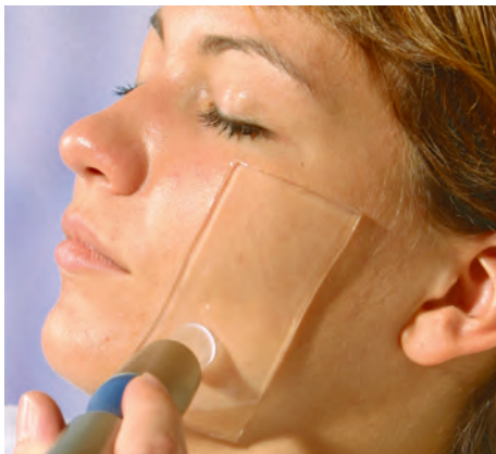
Ryc. 1. Zastosowanie opatrunku hydrożelowego po laserowych zabiegach nieablacyjnych.

wej). Mają one nieprzyjemny zapach i mogą podrażnić drogi oddechowe. Wskazane jest zatem w takich przypadkach stosowanie sterylnych opatrunków chłodzących ograniczających wydzielanie się tych oparów. Hydrożel tworzy nieprzepuszczalną warstwę zabezpieczającą, przez którą nie przedostaną się zanieczyszczenia z zewnątrz. Takie rozwiązanie pozytywnie wpływa na higienę, jakość oraz bezpieczeństwo przeprowadzanych procedur. W zabiegach ablacyjnych, z uwagi na dużą energię przekazywaną tkanom, mogą pojawić się takie reakcje jak: rumień, obrzęk, przebarwienia, blizny przerostowe, zwiększona wrażliwość skóry, co powoduje u pacjenta duży dyskomfort i nie rzadko długą rekonwalescencję. HydroAid®, z racji posiadania dużej pojemności cieplnej, skutecznie chłodzi oraz koi skórę podczas zabiegu, redukując ból do minimum, a także przyspiesza gojenie uszkodzeń naskórka, oparzeń bądź innych, powstałych w wyniku leczenia, urazów skóry. Zastosowanie hydrożelu wpływa na większy komfort pacjenta i tym samym zadowolenie z przeprowadzonego zabiegu (ryc. 1).