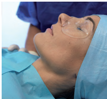
Ryc. 4. Okład Eye Mask po zabiegu plastyki powiek.

HydroAid® doskonale sprawdza się także we flebologii, w zabiegach takich jak laserowe zamykanie poszerzonych naczynek krwionoś-